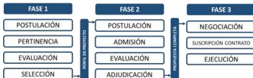
Figura 1: Diagrama de flujo de las tres fases:

Bases de Postulación Convocatoria Nacional Proyectos de innovación de bienes públicos en Sistemas Alimentarios Sostenibles 2023-2024.